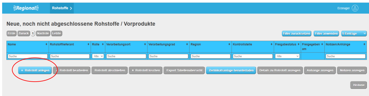
Abbildung 3: Ansicht Datenbank-Regionalfenster Rohstoff anlegen

Rohstoffe können nur von den Unternehmenstypen „Zulieferer/Rohstofflieferant“ und „Zwischenhändler von Rohstoffen/Vorprodukte“ angelegt werden. Durch einen Klick auf den Button „Rohstoffe“ erhält man eine Übersicht über neue nicht abgeschlossene, abgeschlossene, abgemeldete Rohstoffe/Vorprodukte und Rohstoffe/Vorprodukte mit Zertifikatsentzug.