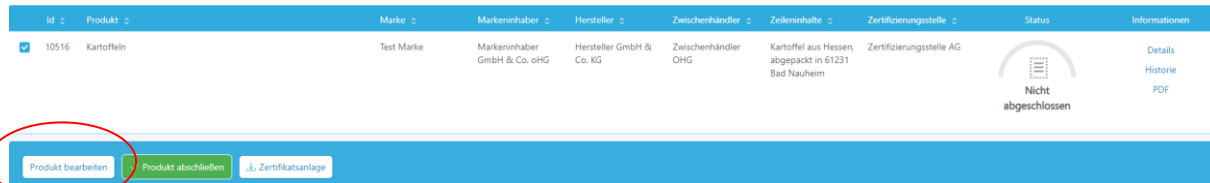
Abbildung 5: Ansicht Datenbank-Regionalfenster Produkt anlegen Hersteller

Der Hersteller hat die Möglichkeit die Tabellenübersicht, das Zertifikat und die entsprechende Zertifikatsanlage herunterzuladen. Über die Filtermöglichkeit „Produktstatus“ kann nach nicht abgeschlossenen, zertifizierten, nicht zertifizierten und abgemeldeten Produkten gefiltert werden.