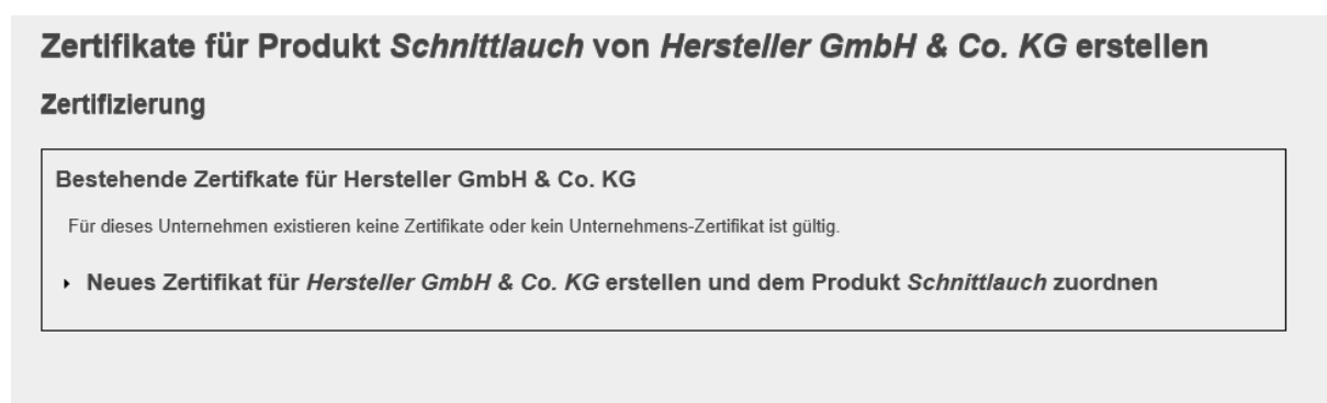
Abbildung 8: Zertifikat zuordnen

Die zu zertifizierenden Rohstoffe/Produkte befinden sich jeweils in der ersten Tabelle unter dem Reiter Rohstoffe bzw. Reiter Produkte. Der zu zertifizierende Rohstoff/das zu zertifizierende Produkt muss angeklickt werden. Im Folgenden erscheint der Button „Rohstoff zertifizieren/Produkt zertifizieren“ blau hinterlegt und muss angeklickt werden. Es öffnet sich eine Eingabemaske: