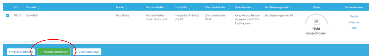
Abbildung 6: Ansicht Datenbank-Regionalfenster Produkt anlegen Zwischenhändler von Produkten

Der Zwischenhändler hat die Möglichkeit die Tabellenübersicht, das Zertifikat und die entsprechende Zertifikatsanlage herunterzuladen. Über die Filtermöglichkeit „Produktstatus“ kann nach nicht abgeschlossenen, zertifizierten, nicht zertifizierten und abgemeldeten Produkten gefiltert werden.