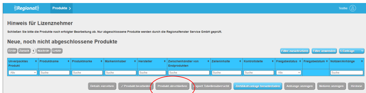
Abbildung 6: Ansicht Datenbank-Regionalfenster Produkt anlegen Zwischenhändler von Produkten

Der Zwischenhändler hat die Möglichkeit die Tabellenübersicht, das Zertifikat und die entsprechende Zertifikatsanlage herunterzuladen. Die abgeschlossenen, abgemeldeten Produkte, Produkte in Überarbeitung und Produkte mit Zertifikatsentzug erscheinen in den weiteren Tabellenübersichten.