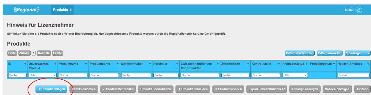
Abbildung 4: Ansicht Datenbank-Regionalfenster Produkt anlegen Markeninhaber

Die Tabelle kann als Übersicht exportiert werden (Button „Export Tabellenübersicht“). Die abgemeldeten Produkte, Produkte in Überarbeitung und Produkte mit Zertifikatsentzug erscheinen in den weiteren Tabellenübersichten.