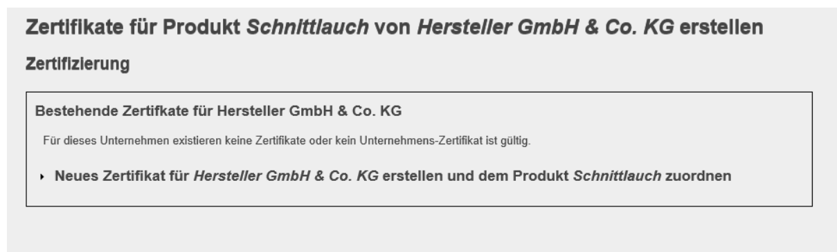
Abbildung 8: Zertifikat zuordnen

Die zu zertifizierenden Rohstoffe/Produkte befinden sich jeweils in der ersten Tabelle unter dem Reiter Rohstoffe bzw. Reiter Produkte. Der zu zertifizierende Rohstoff/das zu zertifizierende Produkt muss angeklickt werden. Im Folgenden erscheint der Button „Rohstoff zertifizieren/Produkt zertifizieren“ blau hinterlegt und muss angeklickt werden. Es öffnet sich eine Eingabemaske: