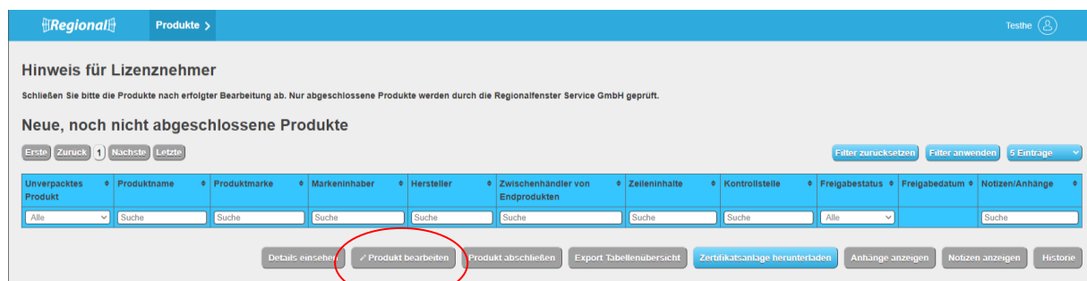
Abbildung 5: Ansicht Datenbank-Regionalfenster Produkt anlegen Hersteller

Der Hersteller hat die Möglichkeit die Tabellenübersicht, das Zertifikat und die entsprechende Zertifikatsanlage herunterzuladen. Die abgeschlossenen, abgemeldeten Produkte, Produkte in Überarbeitung und Produkte mit Zertifikatsentzug erscheinen in den weiteren Tabellenübersichten.