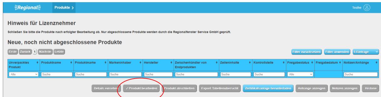
Abbildung 5: Ansicht Datenbank-Regionalfenster Produkt anlegen Hersteller

Der Hersteller hat die Möglichkeit die Tabellenübersicht, das Zertifikat und die entsprechende Zertifikatsanlage herunterzuladen. Die abgeschlossenen, abgemeldeten Produkte, Produkte in Überarbeitung und Produkte mit Zertifikatsentzug erscheinen in den weiteren Tabellenübersichten.