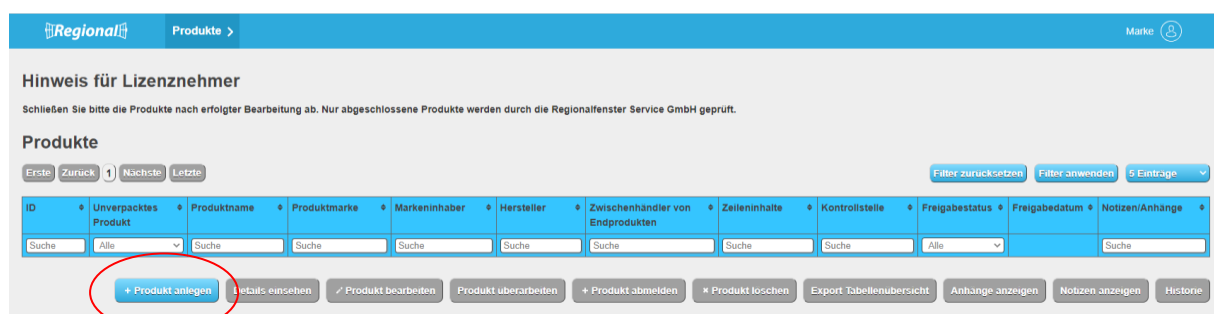
Abbildung 4: Ansicht Datenbank-Regionalfenster Produkt anlegen Markeninhaber

Die Tabelle kann als Übersicht exportiert werden (Button „Export Tabellenübersicht“). Die abgemeldeten Produkte, Produkte in Überarbeitung und Produkte mit Zertifikatsentzug erscheinen in den weiteren Tabellenübersichten.