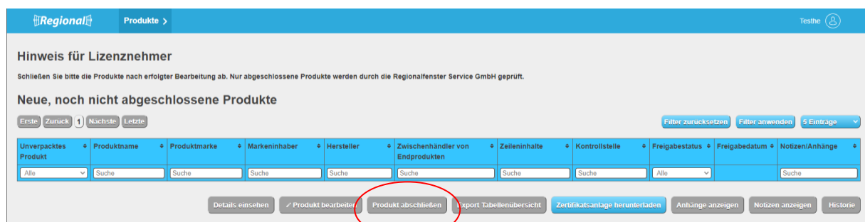
Abbildung 6: Ansicht Datenbank-Regionalfenster Produkt anlegen Zwischenhändler von Produkten

Der Zwischenhändler hat die Möglichkeit die Tabellenübersicht, das Zertifikat und die entsprechende Zertifikatsanlage herunterzuladen. Die abgeschlossenen, abgemeldeten Produkte, Produkte in Überarbeitung und Produkte mit Zertifikatsentzug erscheinen in den weiteren Tabellenübersichten.