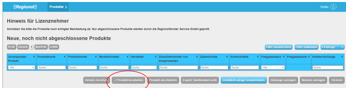
Abbildung 5: Ansicht Datenbank-Regionalfenster Produkt anlegen Hersteller

Der Hersteller hat die Möglichkeit die Tabellenübersicht, das Zertifikat und die entsprechende Zertifikatsanlage herunterzuladen. Die abgeschlossenen, abgemeldeten Produkte, Produkte in Überarbeitung und Produkte mit Zertifikatsentzug erscheinen in den weiteren Tabellenübersichten.